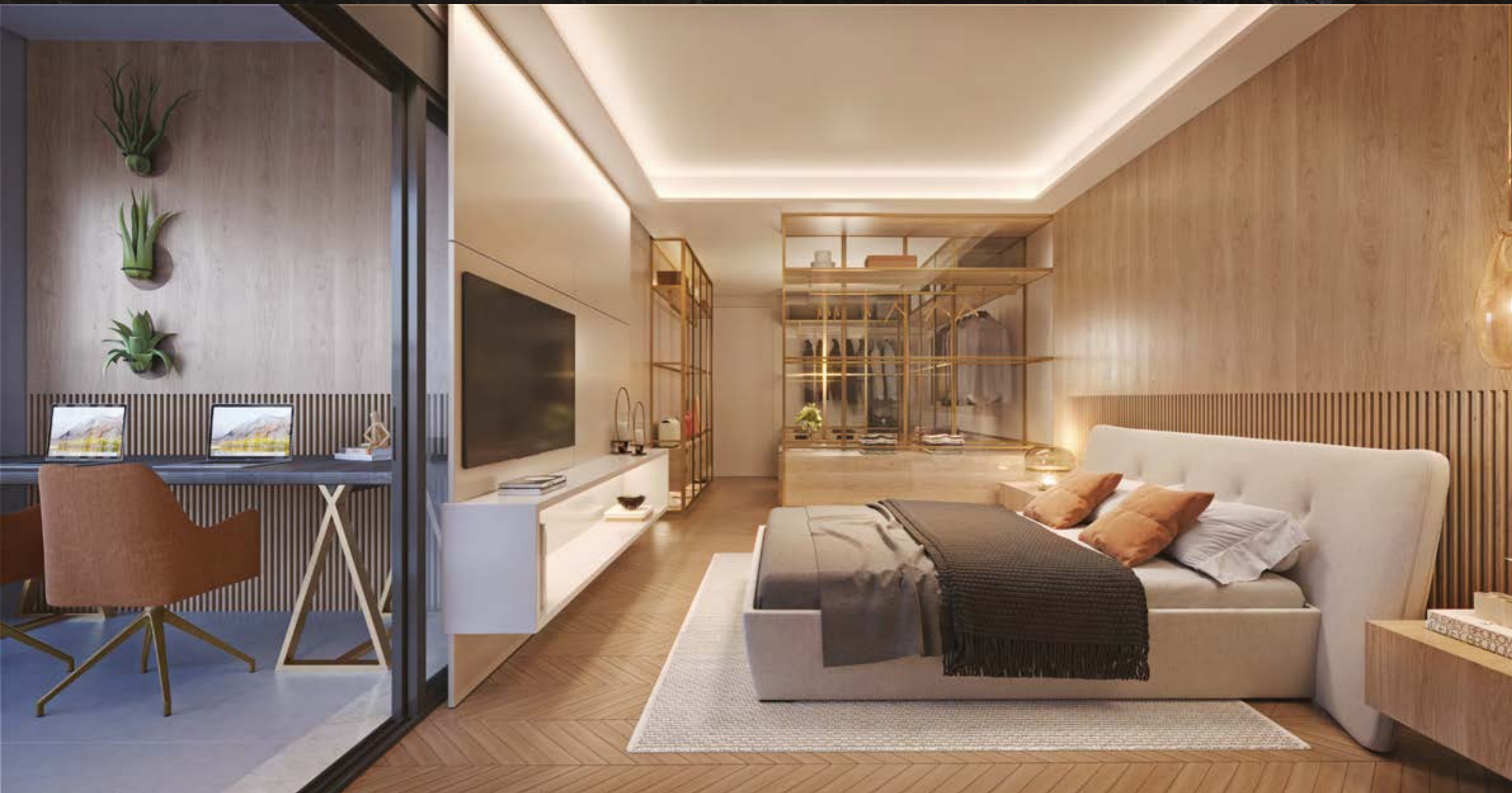
Perspectiva artística detalhada dos terraços, sujeita a alteração