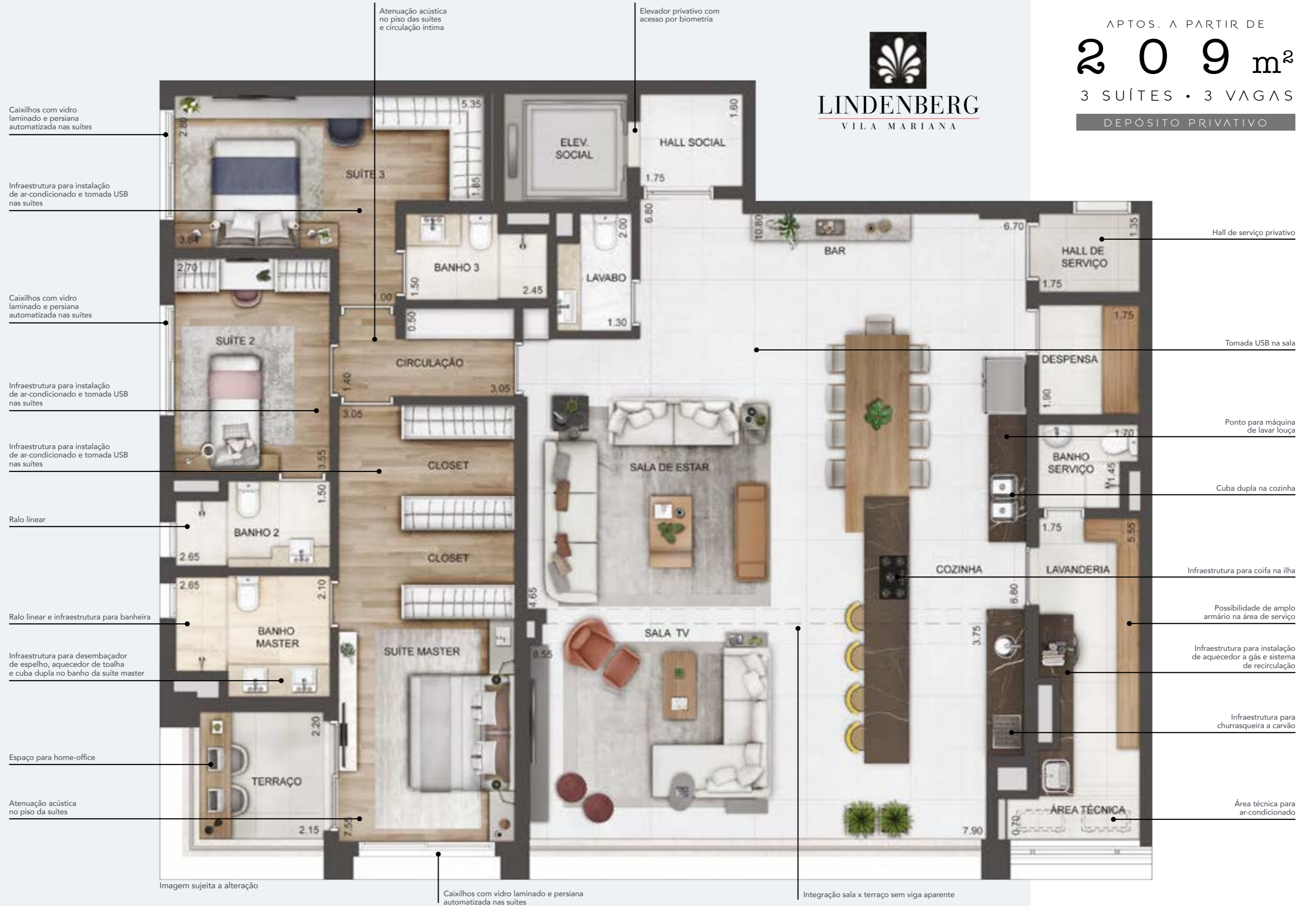
PLANTA TIPO AMPLIADA