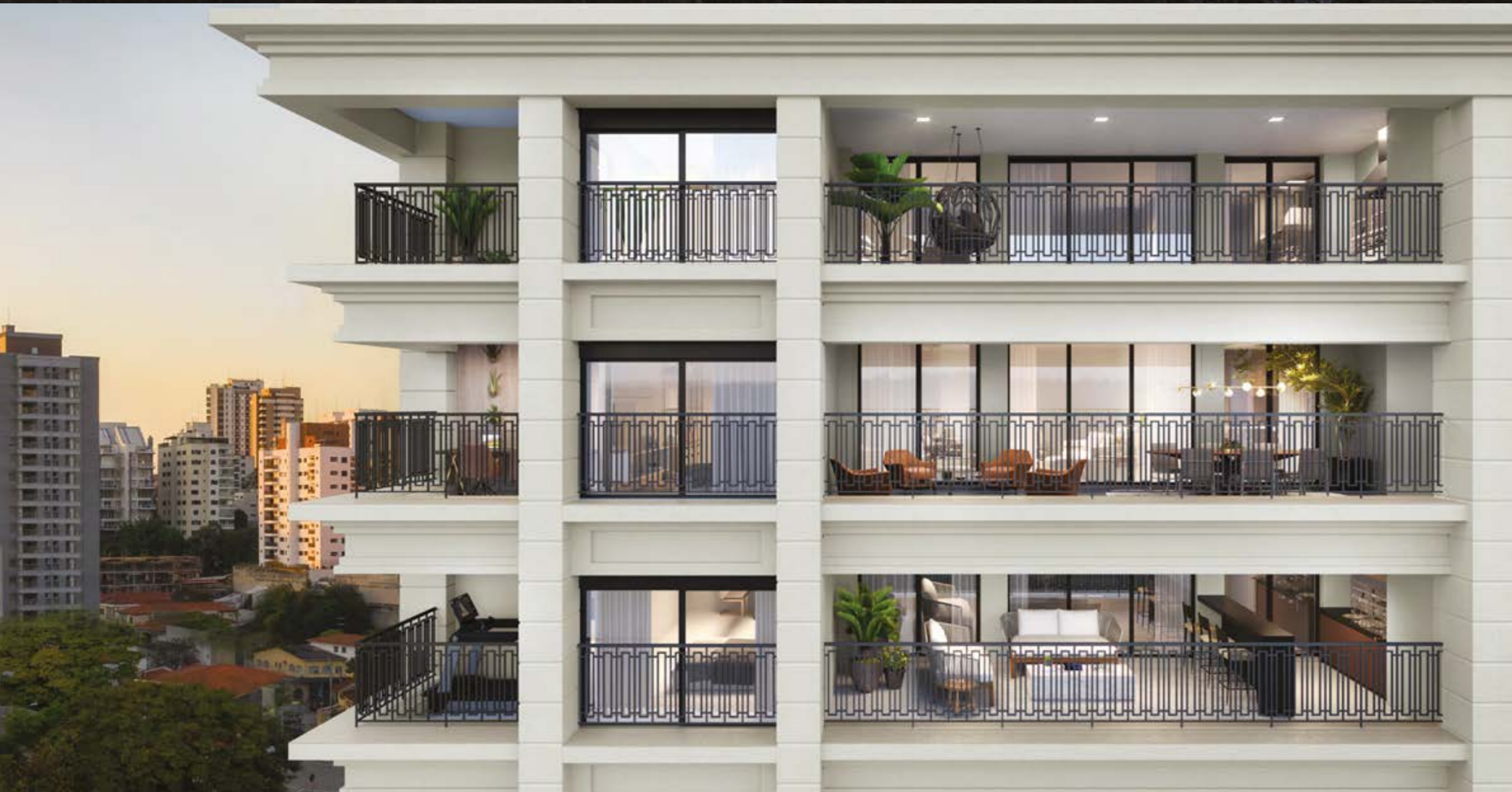
Perspectiva artística detalhada dos terraços, sujeita a alteração