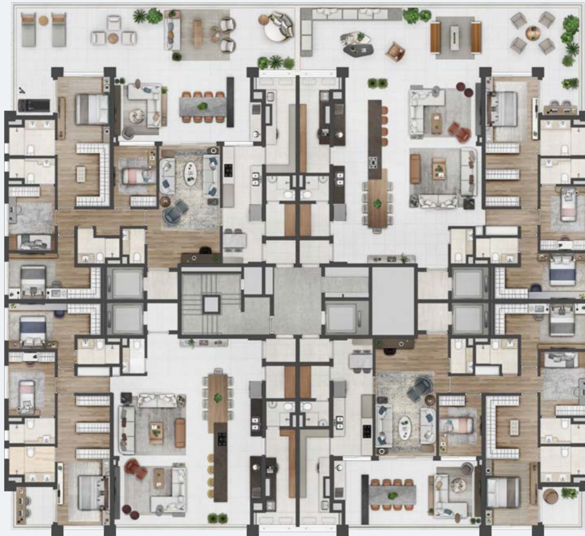
PLANTA PAVIMENTO GIARDINO